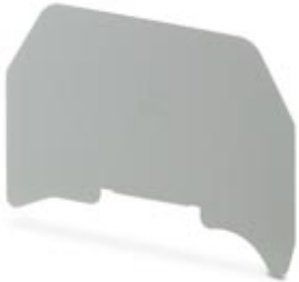
Separating plate, Length: 61 mm, Width: 0.8 mm, Height: 45.5 mm, Color: gray

Please be informed that the data shown in this PDF Document is generated from our Online Catalog. Please find the complete data in the user's documentation. Our General Terms of Use for Downloads are valid ( http://phoenixcontact.com/download )