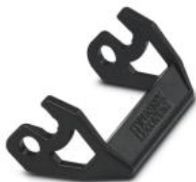
Replacement plastic single locking latch, for HC-EVO-D15.....BK housing

Please be informed that the data shown in this PDF Document is generated from our Online Catalog. Please find the complete data in the user's documentation. Our General Terms of Use for Downloads are valid ( http://phoenixcontact.com/download )