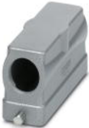
HEAVYCON B24 sleeve housing, for single locking latch, height: 65 mm, with 1 x M25 thread, lateral cable outlet

Please be informed that the data shown in this PDF Document is generated from our Online Catalog. Please find the complete data in the user's documentation. Our General Terms of Use for Downloads are valid ( http://phoenixcontact.com/download )