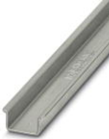
DIN rail, material: Steel, unperforated, 2.3 mm thick, height 15 mm, width 35 mm, length: 2 m

Please be informed that the data shown in this PDF Document is generated from our Online Catalog. Please find the complete data in the user's documentation. Our General Terms of Use for Downloads are valid ( http://download.phoenixcontact.com )