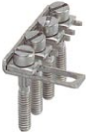
Switching jumper, Number of positions: 4, Color: silver

Please be informed that the data shown in this PDF Document is generated from our Online Catalog. Please find the complete data in the user's documentation. Our General Terms of Use for Downloads are valid ( http://phoenixcontact.com/download )