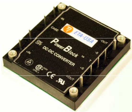
Size: 60.70mm x 57.91mm x 13.30mm (2.39in. x 2.28in. x 0.52in.)