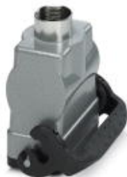
HEAVYCON B10 coupling housing, with single locking latch, height: 77.5 mm, with 1 x M25 gland, straight cable outlet

Please be informed that the data shown in this PDF Document is generated from our Online Catalog. Please find the complete data in the user's documentation. Our General Terms of Use for Downloads are valid ( http://phoenixcontact.com/download )