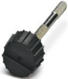
Fillister head screw with plastic knurl, M3 x 40

Please be informed that the data shown in this PDF Document is generated from our Online Catalog. Please find the complete data in the user's documentation. Our General Terms of Use for Downloads are valid ( http://phoenixcontact.com/download )