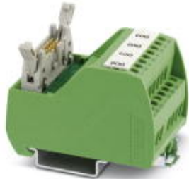
VARIOFACE Professional (VIP) module for Siemens ET200 ISP controllers

Please be informed that the data shown in this PDF Document is generated from our Online Catalog. Please find the complete data in the user's documentation. Our General Terms of Use for Downloads are valid ( http://phoenixcontact.com/download )