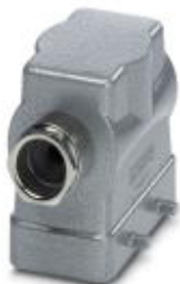
HEAVYCON sleeve housing B10, for double locking latch, height 72 mm, with screw connection 1x M25, lateral conductor exit

Please be informed that the data shown in this PDF Document is generated from our Online Catalog. Please find the complete data in the user's documentation. Our General Terms of Use for Downloads are valid ( http://phoenixcontact.com/download )