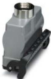
HEAVYCON B24 coupling housing, with single locking latch, height: 80.5 mm, with 1 x M25 gland, straight cable outlet

Please be informed that the data shown in this PDF Document is generated from our Online Catalog. Please find the complete data in the user's documentation. Our General Terms of Use for Downloads are valid ( http://phoenixcontact.com/download )