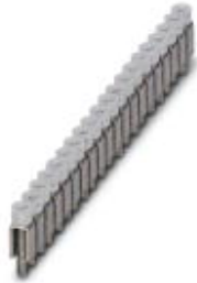
Fixed bridge, Number of positions: 20, Color: silver

Please be informed that the data shown in this PDF Document is generated from our Online Catalog. Please find the complete data in the user's documentation. Our General Terms of Use for Downloads are valid ( http://download.phoenixcontact.com )