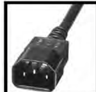
Dual Voltage (IEC320 C14)