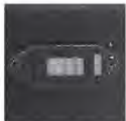
Dual Voltage Selector

ORION FANS fan trays are available in dozens of stock configurations. If you cannot find what you are looking for give us a call. We can design and build your trays from scratch or we can help you come up with solutions for your toughest problems.