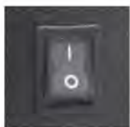
Lighted on/off rocker