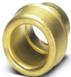
End sleeves as cable protection, made of brass, for WP-STEEL PVC C

Please be informed that the data shown in this PDF Document is generated from our Online Catalog. Please find the complete data in the user's documentation. Our General Terms of Use for Downloads are valid ( http://phoenixcontact.com/download )