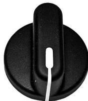
5940E, 5920E, 5930E