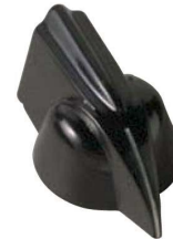
5600E, 5601E, 5602E