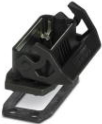
HEAVYCON EVO panel mounting base, plastic, D15, with single locking latch, with flat gasket

Please be informed that the data shown in this PDF Document is generated from our Online Catalog. Please find the complete data in the user's documentation. Our General Terms of Use for Downloads are valid ( http://phoenixcontact.com/download )