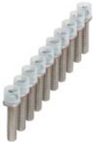
Bridge bar isolator, Number of positions: 10, Color: silver

Please be informed that the data shown in this PDF Document is generated from our Online Catalog. Please find the complete data in the user's documentation. Our General Terms of Use for Downloads are valid ( http://download.phoenixcontact.com )