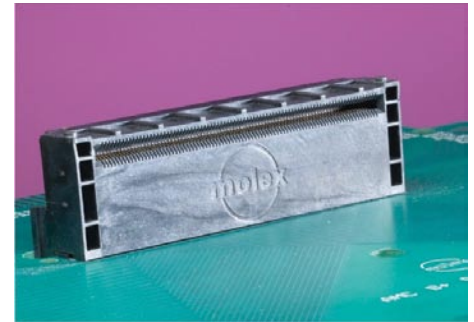
Series 75800 Standard AMC.0 B+ Connector

Three versions of the Molex AMC.0 B+ connector exist: the standard connector with locating pegs (series 75800), connector without pegs (series 75908) and the 1.15mm (.045") extended-height connector (series 75791). This taller height is optimized for blade-server applications where cooling is critical.