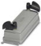
HEAVYCON ADVANCE IP65 protective cover B24, with bayonet locking, with retaining cord, diameter of retaining cord eyelet 3 mm

Protective covers - HC-B 24-TMB-SD-IP65 - 1690969