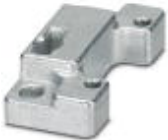
Panel mounting flange for HEAVYCON ADVANCE TMB housing with bayonet locking