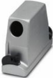
HEAVYCON ADVANCE EMV sleeve housing B24, with bayonet locking, height 100 mm, with 1xM32 thread, lateral cable outlet

Please be informed that the data shown in this PDF Document is generated from our Online Catalog. Please find the complete data in the user's documentation. Our General Terms of Use for Downloads are valid ( http://download.phoenixcontact.com )