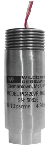
Table 1: PC420Vx-yy-EX model selection guide