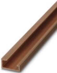
G-profile DIN rail, deep-drawn, material: Copper, unperforated, height 15 mm, width 32 mm, length 2 m

Please be informed that the data shown in this PDF Document is generated from our Online Catalog. Please find the complete data in the user's documentation. Our General Terms of Use for Downloads are valid ( http://download.phoenixcontact.com )