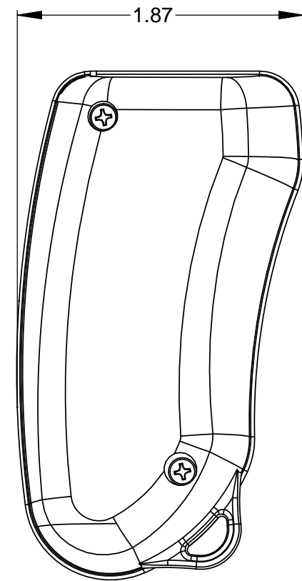
TOP VIEW SHOWING CIRCUIT BOARD DIMENSIONS