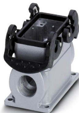
Figure shows a product variant with a height of 74 mm

http://eshop.phoenixcontact.de/phoenix/treeViewClick.do?UID=1604754