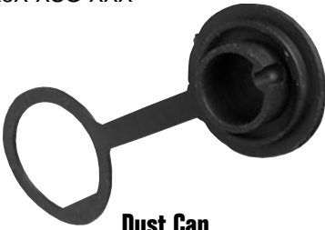
Dust Cap 4295