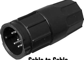
Cable to Cable 5X8X-XXG-XXX Matching Mates: • Cable Pin 3X8X-XPB-XXX • Cable Socket 3X8X-XSG-XXX