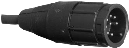
Cable to Cable