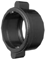
Winged Coupling Ring W/4482