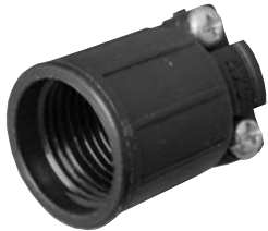
Mechanical Back Shell (Style #5)