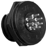
P/C Tail Panel Mount 4XXX-XXG-XXX Matching Mates: • Cable Pin 3X8X-XPB-XXX • Cable Socket 3X8X-XSG-XXX