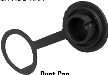
Dust Cap 4295