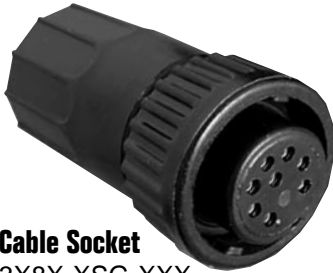
Cable Socket 3X8X-XSB-XXX Matching Mates: • Cable-Cable 5X8X-XPB-XXX • Panel 4XXX-XPB-XXX