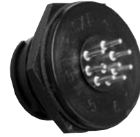
P/C Tail Panel Mount 4XXX-XXG-XXX Matching Mates: • Cable Pin 3X8X-XPB-XXX • Cable Socket 3X8X-XSG-XXX