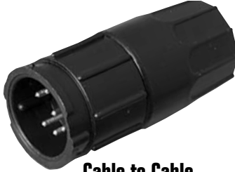
Cable to Cable 5X8X-XXG-XXX Matching Mates: • Cable Pin 3X8X-XPB-XXX • Cable Socket 3X8X-XSG-XXX