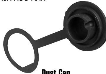
Dust Cap 4295