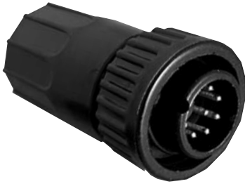
Cable Pin 3X8X-XPB-XXX Matching Mates: • Cable-Cable 5X8X-XSG-XXX • Panel 4XXX-XSG-XXX