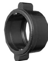
Winged Coupling Ring W/4482