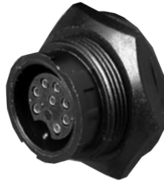
Panel Mount 4X8X-XXG-XXX Matching Mates: • Cable Pin 3X8X-XPB-XXX • Cable Socket 3X8X-XSG-XXX