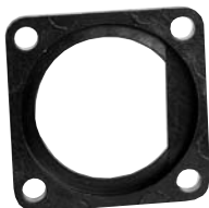
Square Flange Adapter 4296