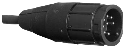
Cable to Cable