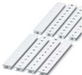
Zack marker strip, 10-section, horizontally labeled with the consecutive numbers: 221 ... 230, white, width: 8 mm

Please be informed that the data shown in this PDF Document is generated from our Online Catalog. Please find the complete data in the user's documentation. Our General Terms of Use for Downloads are valid ( http://phoenixcontact.com/download )