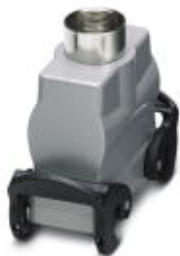
HEAVYCON B16 sleeve housing, with double locking latch, height: 72 mm, with 1 x M32 gland, straight cable outlet

Please be informed that the data shown in this PDF Document is generated from our Online Catalog. Please find the complete data in the user's documentation. Our General Terms of Use for Downloads are valid ( http://phoenixcontact.com/download )