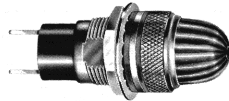
377-0410-1191-203 Stovepipe lens