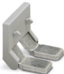
Insertion bridge, Number of positions: 2, Color: gray

Please be informed that the data shown in this PDF Document is generated from our Online Catalog. Please find the complete data in the user's documentation. Our General Terms of Use for Downloads are valid ( http://download.phoenixcontact.com )