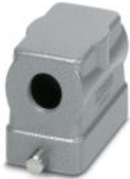
HEAVYCON B6 sleeve housing, for single locking latch, height: 56 mm, with 1 x M25 thread, lateral cable outlet

Please be informed that the data shown in this PDF Document is generated from our Online Catalog. Please find the complete data in the user's documentation. Our General Terms of Use for Downloads are valid ( http://phoenixcontact.com/download )