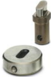
Stamping bit, for elongated hole: 3.5 x 12 mm

Please be informed that the data shown in this PDF Document is generated from our Online Catalog. Please find the complete data in the user's documentation. Our General Terms of Use for Downloads are valid ( http://download.phoenixcontact.com )