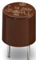
Replacement fuse, for INTERBUS-ST modules

Please be informed that the data shown in this PDF Document is generated from our Online Catalog. Please find the complete data in the user's documentation. Our General Terms of Use for Downloads are valid ( http://phoenixcontact.com/download )