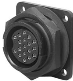
Panel Mount 14X8X-XXXG-XXX Matching Mates: • Cable Pin 13X8X-XXPG-XXX • Cable Socket 13X8X-XXSG-XXX