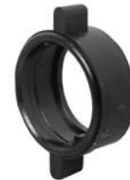
Winged Coupling Ring W/14482