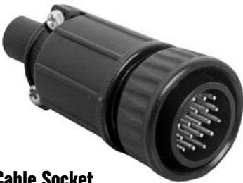
Cable Socket 13X8X-XXSG-XXX Matching Mates: • Cable-Cable 15X8X-XXPG-XXX • Panel 14XXX-XXPG-XXX