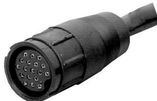
Cable to Cable