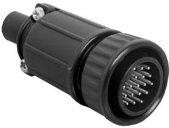
Cable Pin 13X8X-XXPG-XXX Matching Mates: • Cable-Cable 15X8X-XXSG-XXX • Panel 14XXX-XXSG-XXX