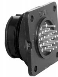
P/C Tail Panel Mount 14XXX-XXXG-XXX Matching Mates: • Cable Pin 13X8X-XXPG-XXX • Cable Socket 13X8X-XXSG-XXX