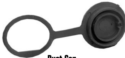
Dust Cap 14295