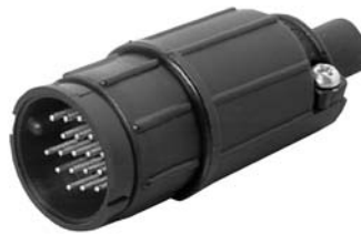
Cable to Cable 15X8X-XXXG-XXX Matching Mates: • Cable Pin 13X8X-XXPG-XXX • Cable Socket 13X8X-XXSG-XXX