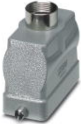
HEAVYCON B24 sleeve housing, for single locking latch, height: 76 mm, with 1 x Pg29 gland, straight cable outlet

Please be informed that the data shown in this PDF Document is generated from our Online Catalog. Please find the complete data in the user's documentation. Our General Terms of Use for Downloads are valid ( http://download.phoenixcontact.com )