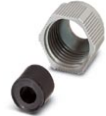
D-SUB cap nut with line seal, for conductor diameter of 5 mm ... 13 mm, for sleeve housing VS-25-...

Please be informed that the data shown in this PDF Document is generated from our Online Catalog. Please find the complete data in the user's documentation. Our General Terms of Use for Downloads are valid ( http://download.phoenixcontact.com )