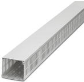
Cable duct, white, comprising upper part and mounting base, width: 25 mm, height: 25 mm, length: 2000 mm

Please be informed that the data shown in this PDF Document is generated from our Online Catalog. Please find the complete data in the user's documentation. Our General Terms of Use for Downloads are valid ( http://download.phoenixcontact.com )