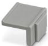
Equipment marker, width 12 mm