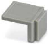
Equipment marker, narrow

Marking material - EMG-SGKS 10 - 2947585