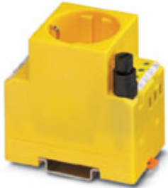
Rail-mountable socket, with glow lamp and equipment fusing 5 x 20 mm to max. 6.3 A; yellow housing

Please be informed that the data shown in this PDF Document is generated from our Online Catalog. Please find the complete data in the user's documentation. Our General Terms of Use for Downloads are valid ( http://phoenixcontact.com/download )