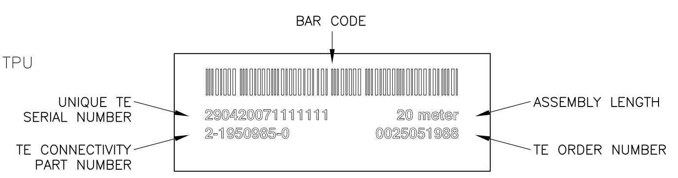
LABEL DETAIL: 3