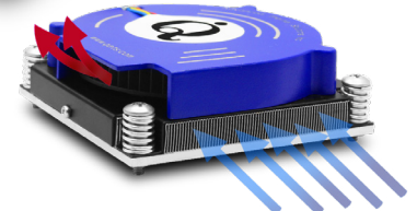
dualFLOW™ airflow direction