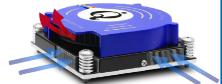
quadFLOW™ airflow direction