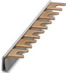
Wiring bridge for modules with connecting pitch 17.5 mm, 1-phase, 3-pos.

Please be informed that the data shown in this PDF Document is generated from our Online Catalog. Please find the complete data in the user's documentation. Our General Terms of Use for Downloads are valid ( http://download.phoenixcontact.com )