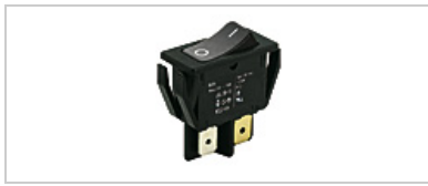
Similar to original product