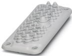
Cable feed-through plates, No. of conductors: 37, Length: 92 mm, Width: 222 mm, Height: 43 mm, Color: light gray

Please be informed that the data shown in this PDF Document is generated from our Online Catalog. Please find the complete data in the user's documentation. Our General Terms of Use for Downloads are valid ( http://phoenixcontact.com/download )