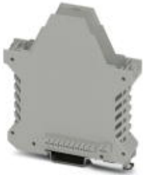
Component housing, color: gray

Please be informed that the data shown in this PDF Document is generated from our Online Catalog. Please find the complete data in the user's documentation. Our General Terms of Use for Downloads are valid ( http://phoenixcontact.com/download )