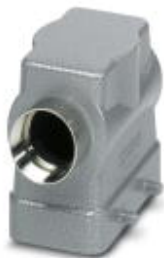
HEAVYCON B10 sleeve housing, for double locking latch, height: 72 mm, with 1 x M25 gland, lateral cable outlet

Please be informed that the data shown in this PDF Document is generated from our Online Catalog. Please find the complete data in the user's documentation. Our General Terms of Use for Downloads are valid ( http://phoenixcontact.com/download )