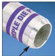
Corona Relief Taper